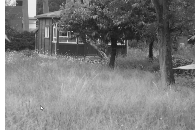
Blick Garten Richtung Gebäude